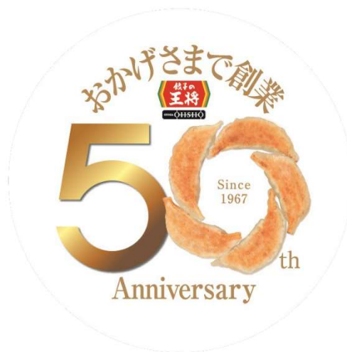
創業50周年ロゴマーク